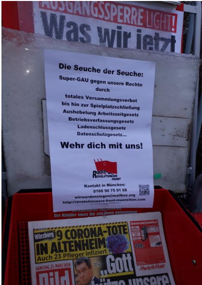
Gesichtert am Busdepot der MVG