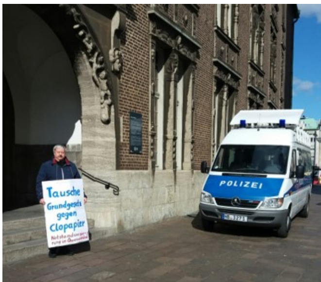
„Tausche Grundgesetz gegen Klopapier“, Bremen

Materialien zur Meinungsäußerung sind genug vorhanden. Ihr könnt sie abholen, per Post bekommen... Meldet euch, damit mehr Stadtteile schöner werden!